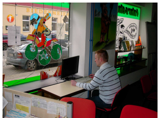
Bild: Lernen am PC

Lernen in Kombination - Internet und Lernmittel